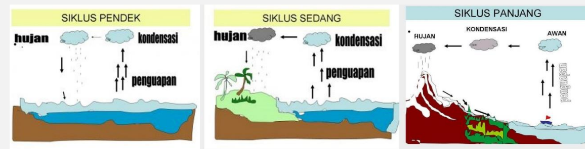
Contoh tugas project based learning siklus hidrologi